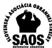
Slovenská Asociácia Obrannej Strelby