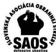
Slovenská Asociácia Obrannej Strelby